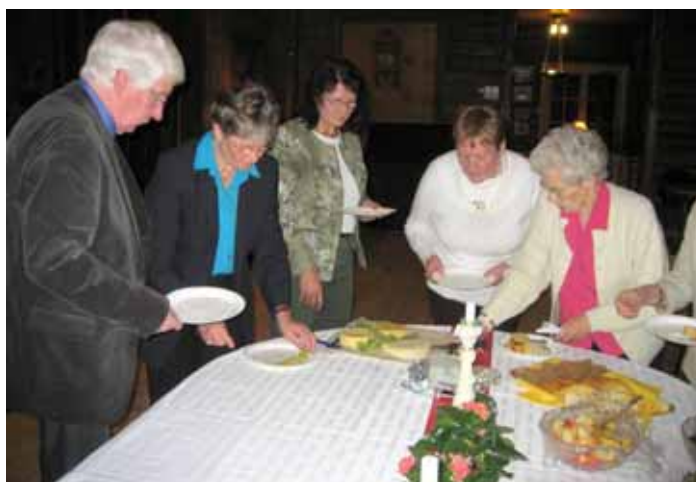
Ost- och vinaftonens deltagare