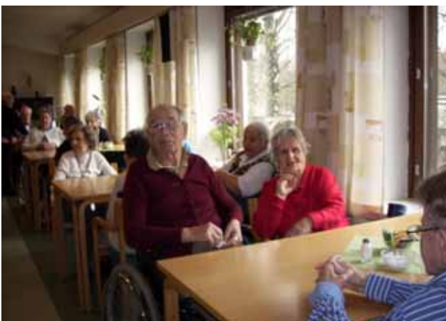
Åhörare på Helenahemmet