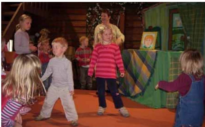
Den unga publiken deltog i dansen