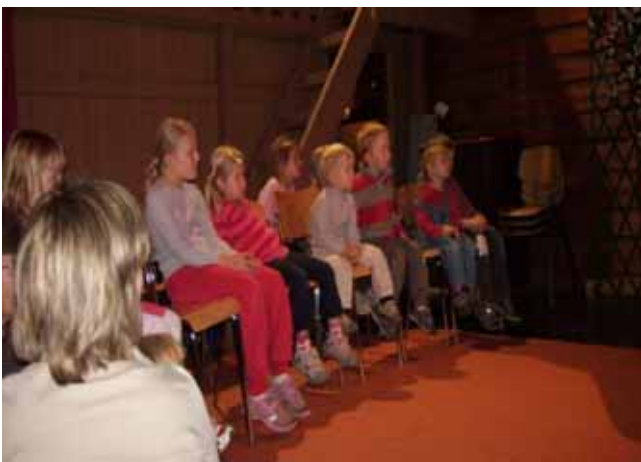
Små åhörare på Höstmarknaden