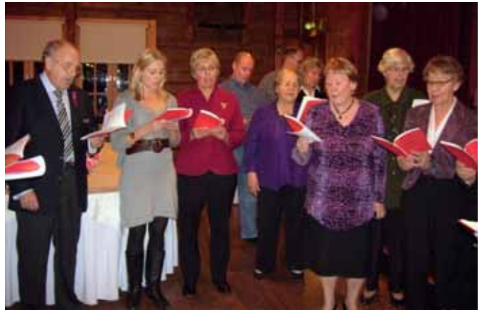
Sång vid granen på julfesten