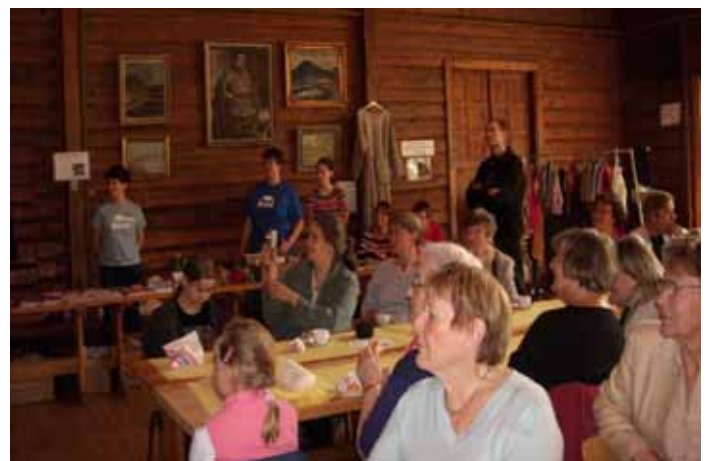
Åhörare på Höstmarknaden