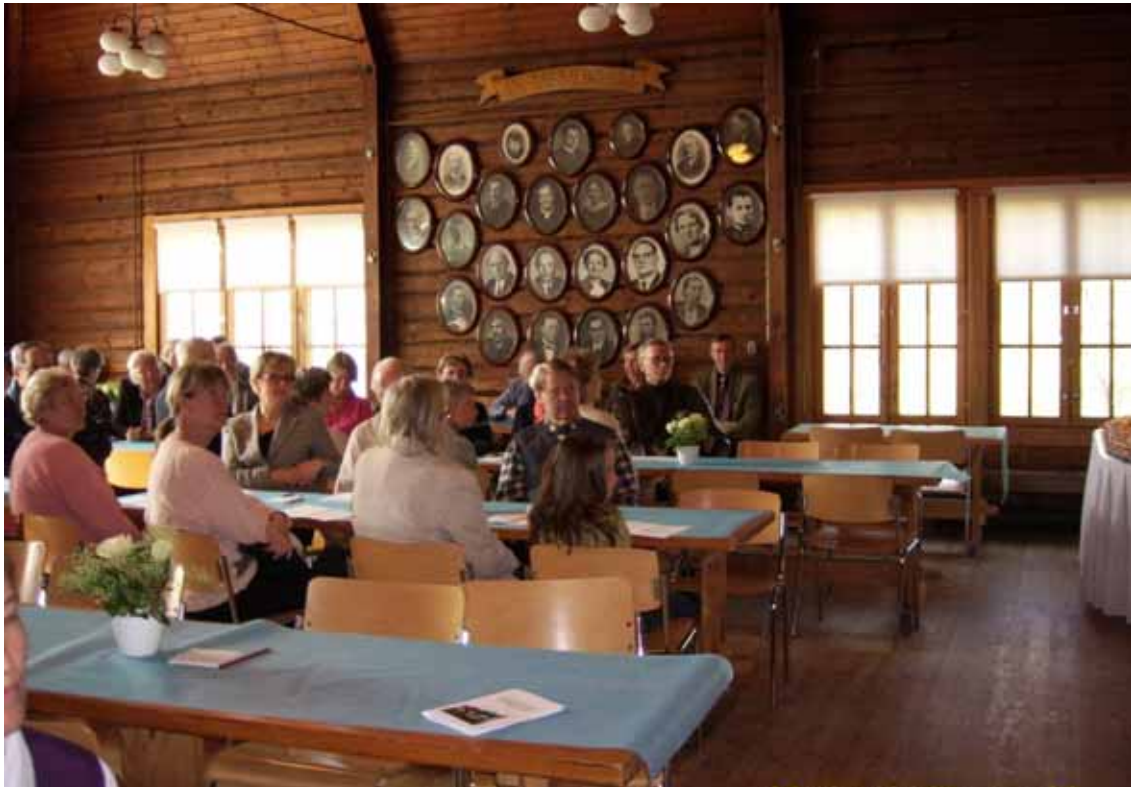
Åhörare vid Islossningskonserten 2007