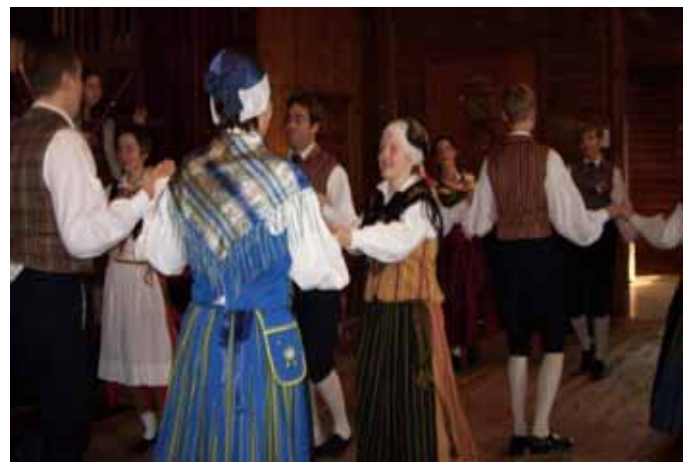
Folkdans på Höstmarknaden