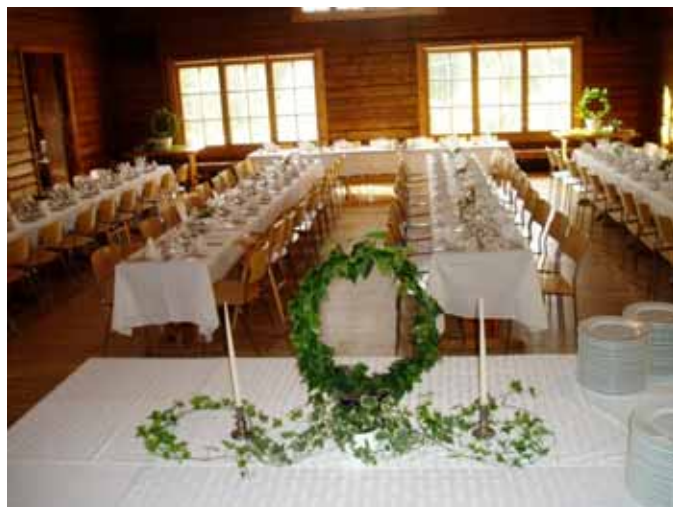
Stora salen i Bergghyddan