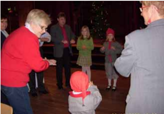
Ringlekar på julfesten