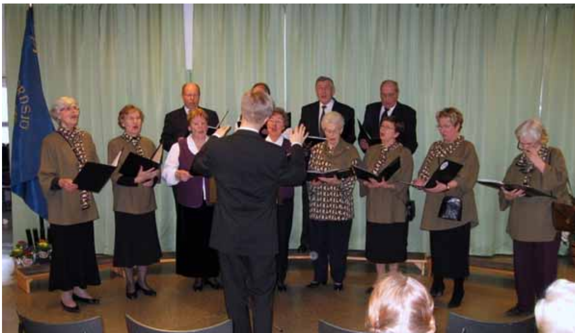
Och sången väller fram