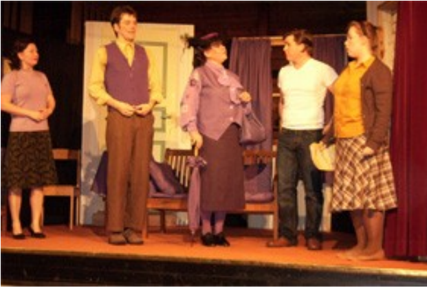
Vanda Teaterförening och En fästmö till låns