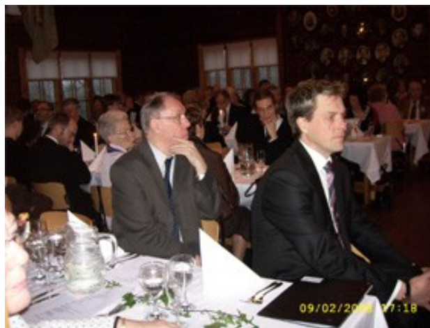
Publik vid 100-års jubileumsfesten