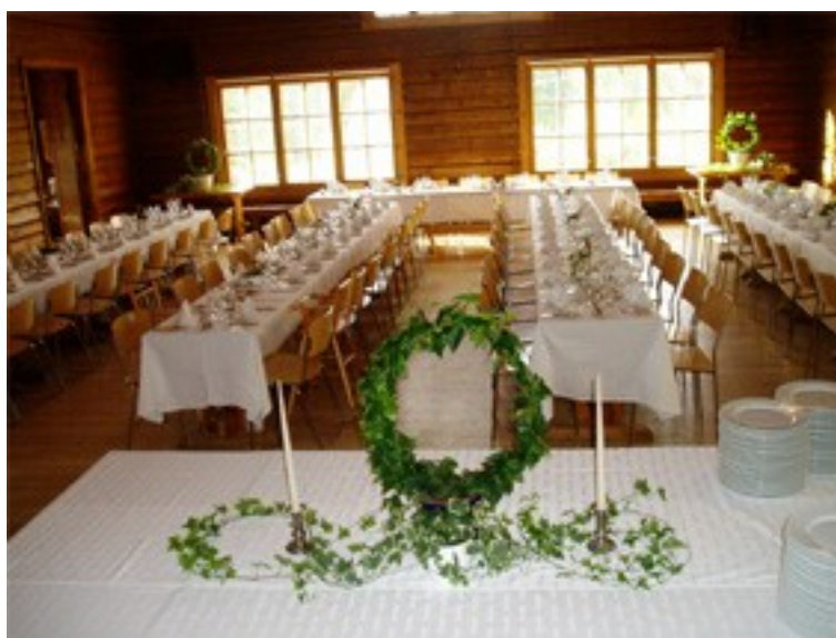
Stora salen i Berghyddan