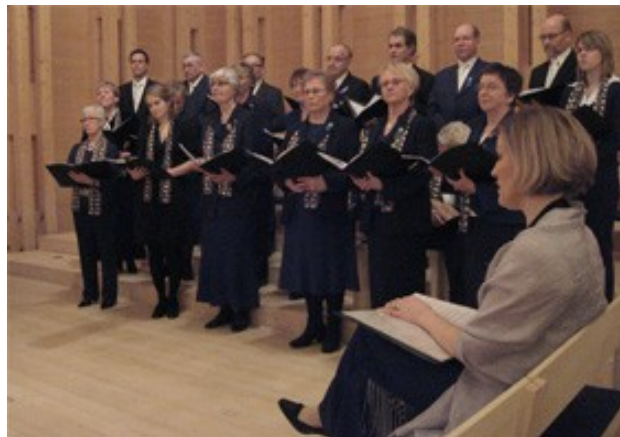
GUF-kören i Viks kyrka