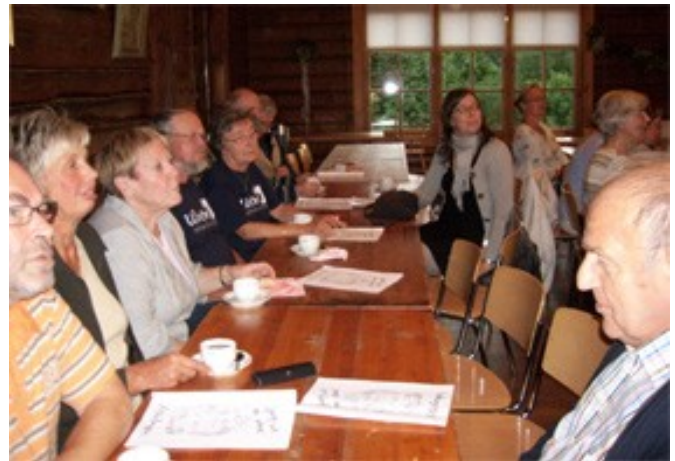
Publik vid Allsången