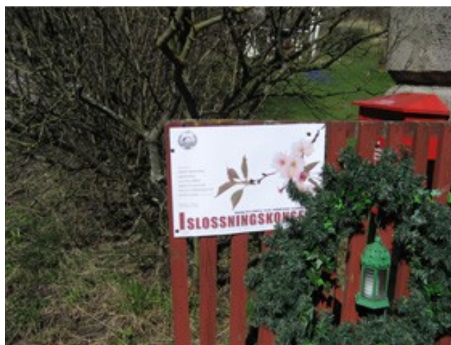
Grinden vid Berghyddan i festskrud 20.4.2008