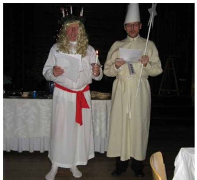
Lucia och Stjärngosse vid körsitsen 12.12.2008