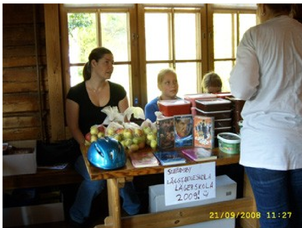
Skolelever säljer bakverk