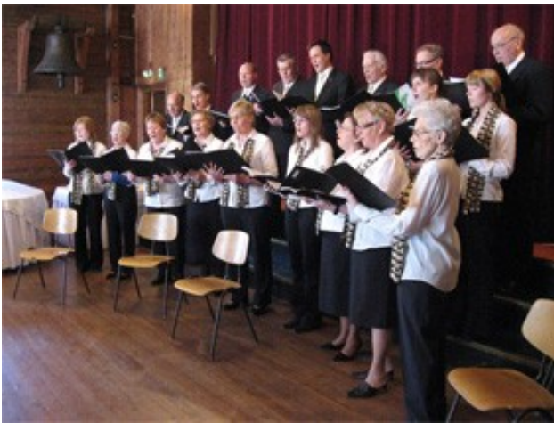
GUF-kören vid Islossningskonserten