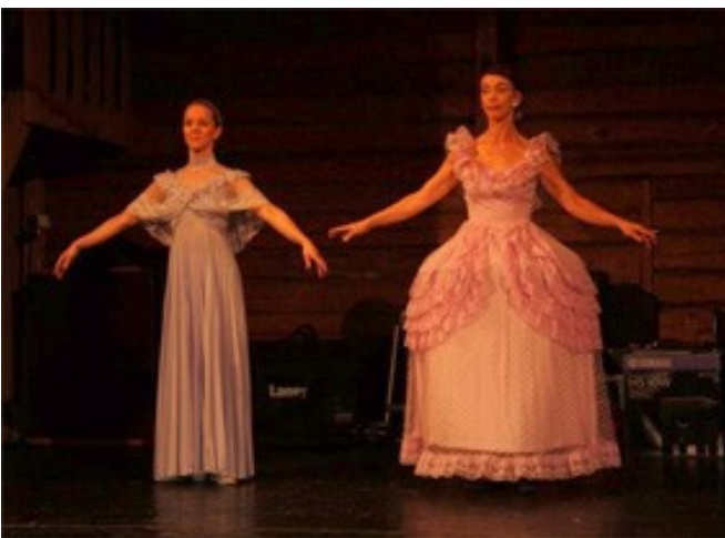
Dansteatern Dis Tanz vid Höstfesten