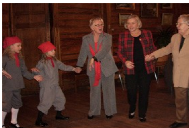
På julfesten dansades ringlekar