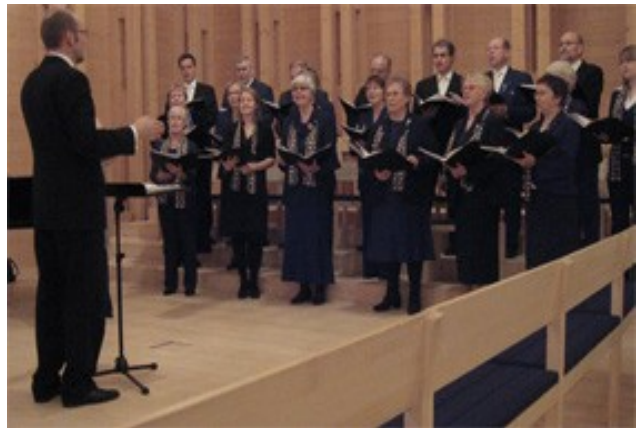
GUF-körens julkonsert 12.12.2008