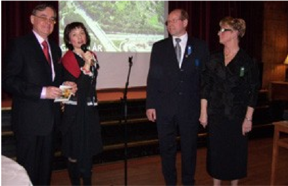
Ordföranden och viceordförande tar emot uppvaktningar