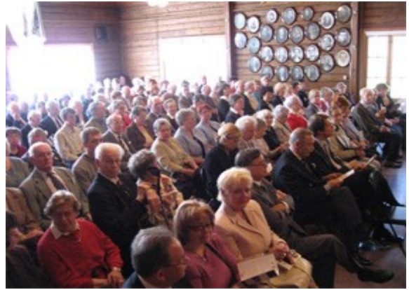
Publik vid Islossningskonserten