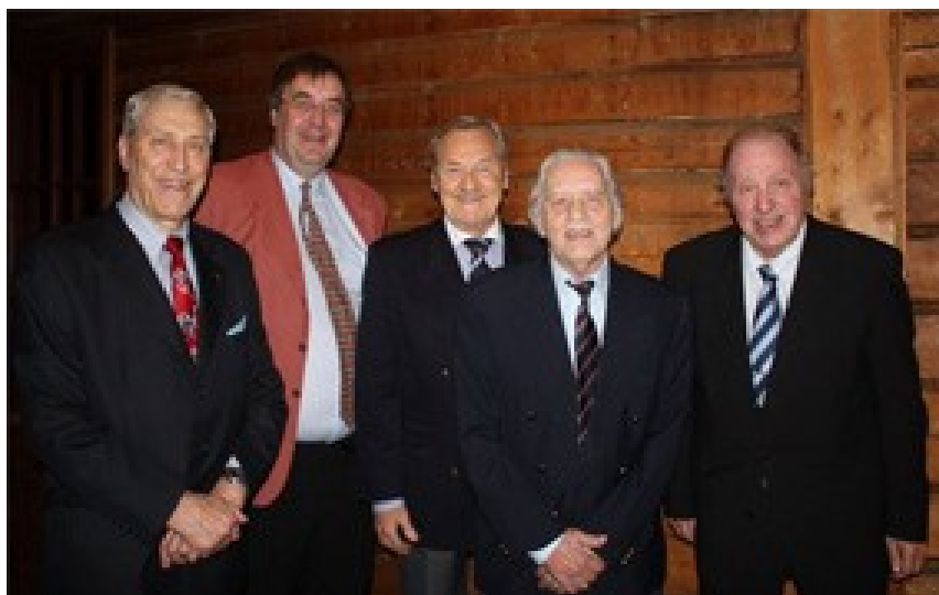
Kusiner och småkusiner träffas i glada tecken